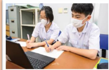
Google Chat 上でのメンターの方とのやりとり