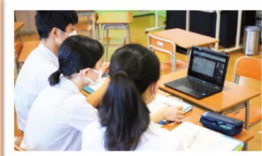
Google Meet を使って、メンターの方にアイデアを発表