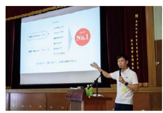
基調講演とオリエンテーション