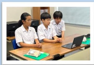
Google Meet を使って、メンターの方にアイデアを発表する様子