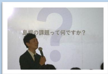
オリエンテーションの様子

○お車でお越しの場合は、前期課程の正門からお入りいただき、山陰教員研修センターの駐車場をご利用ください（裏面参照）。