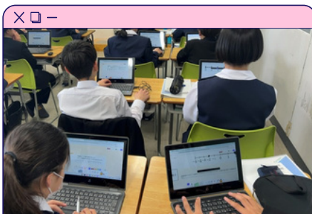
クラウドを活用して協働的に学ぶ姿