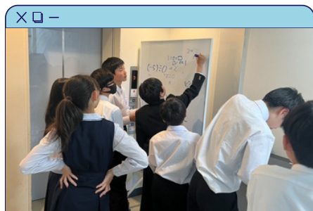
自ら協働的に学ぶ姿